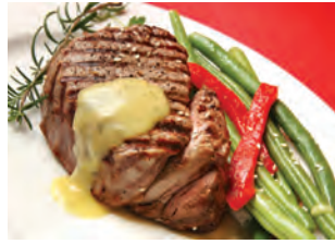
Entrecôte sauce au poivre