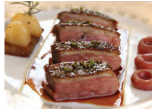
Magret de canard