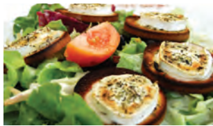
Salade au fromage de chèvre chaud