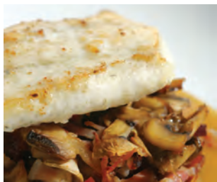
Turbot aux champignons