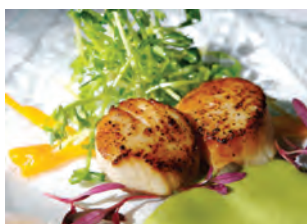
Coquilles Saint-Jacques au beurre